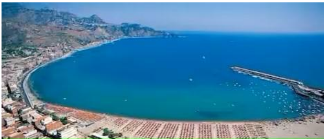
Vista della Baia lato Nord con Taormina sullo sfondo