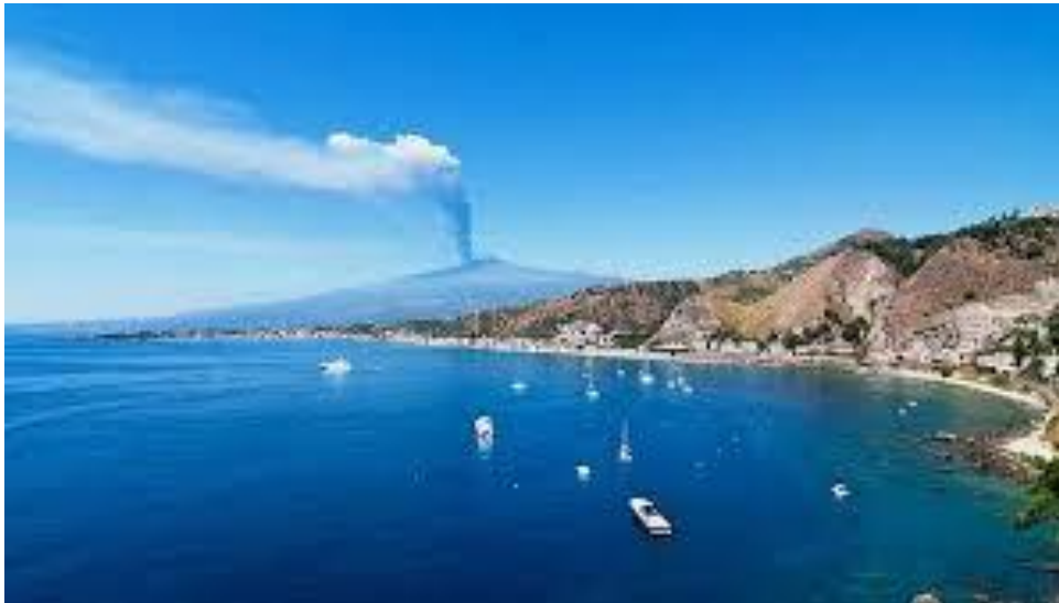
Vista della baia di Giardini Naxos lato Sud con l'Etna sullo sfondo

Si colloca tra i primi posti tra le città a vocazione turistica italiane per le sue bellezze naturali e le sue attrattive culturali e culinarie, famose le sue spiagge dorate fornite di tutti i servizi turistici che si intersecano con la roccia vulcanica dell' Etna.